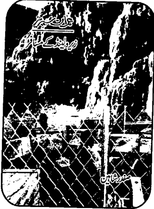
عمران سیریز میں زیرو لینڈ کے لئے عمران کا شاندار ایڈیو پیجر

روبوٹس کے پرچے اڑا دیئے۔ کیوں؟ عمران نے ریڈ وولف کو برعقال بنا کر اپنے حکم کی تعمیل کرنے پر مجبور کر دیا۔ کون سا حکم؟ □ آپیس باؤل میں عمران نے سپریم کمانڈر کو آپیس اسٹیشن تباہ کرنے کی دھمکی دی اور دوسرے ہی لمحے آپیس اسٹیشن کے پرچے اڑ گئے۔ کیسے؟